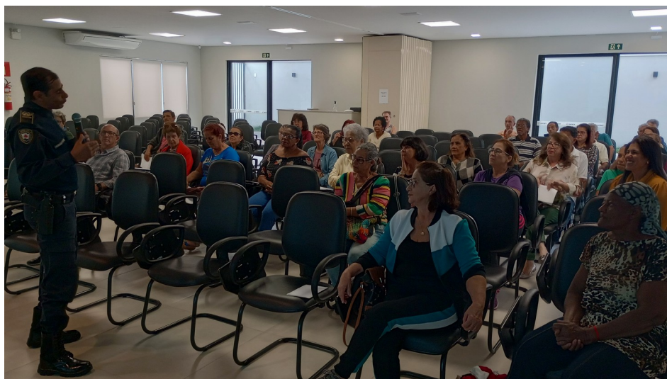
FIGURA 5 – APRESENTAÇÃO DA PALESTRA PREVENÇÃO CONTRA CRIMES CIBERNÉTICOS

No segundo dia foi promovido a palestra Prevenção Contra Crimes Cibernéticos realizada pela Guarda Civil Municipal, alertando os aposentados sobre as mais variadas formas de golpes existentes na internet e as medidas que podem ser tomadas para a prevenção e identificação destes golpes.