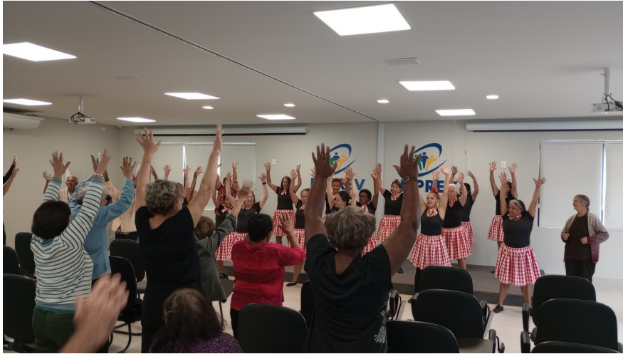
FIGURA 4 – INÍCIO DAS ATIVIDADES DA 2ª SEMANA DO SERVIDOR PÚBLICO APOSENTADO

No segundo dia foi promovido a palestra Prevenção Contra Crimes Cibernéticos realizada pela Guarda Civil Municipal, alertando os aposentados sobre as mais variadas formas de golpes existentes na internet e as medidas que podem ser tomadas para a prevenção e identificação destes golpes.