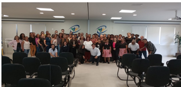
FIGURA 10 - 2ª EDIÇÃO DA SEMANA DO SERVIDOR PÚBLICO APOSENTADO