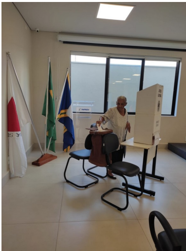
FIGURA 8 - ELEIÇÕES

Esta edição apresenta o resultado das ações realizadas no 1º Semestre de 2023: