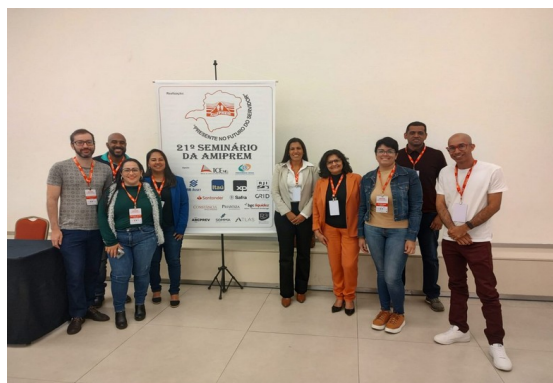
FIGURA 9 - 21º SEMINÁRIO AMIPREM