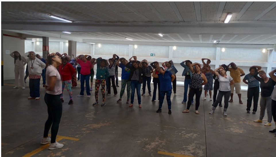
FIGURA 6 – ATIVIDADE FÍSICA COM TÉCNICA DESPORTIVA DA SEMEL

Os participantes ficaram satisfeitos com a organização e os conteúdos apresentados durante a semana, bem como pela iniciativa do Instituto em proporcionar um momento de interação, atualização de conhecimentos e descontração.