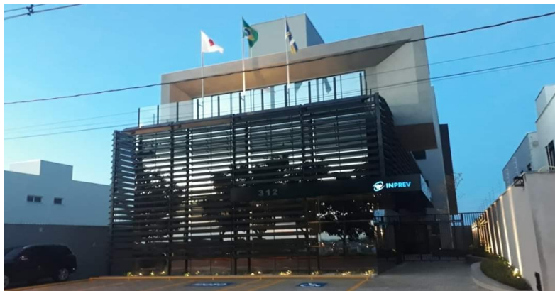
FIGURA 1 - SEDE DO RPPS

Compete ao INPREV assegurar aos seus beneficiários, mediante contribuição, a concessão dos benefícios de aposentadoria e pensão por morte, além de garantir o gerenciamento, a manutenção e a operacionalização do pagamento dos benefícios previdenciários aos seus segurados e dependentes, com a gestão responsável dos recursos financeiros.