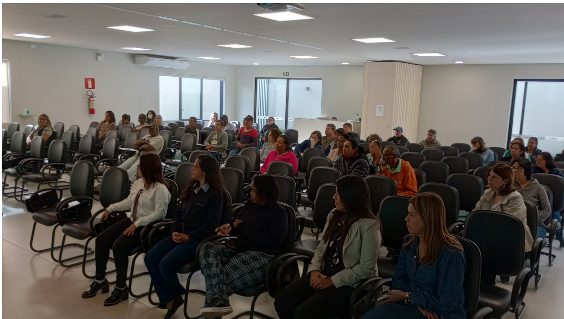
FIGURA 3 – 1º CICLO PROGRAMA DESPERTAR 2023