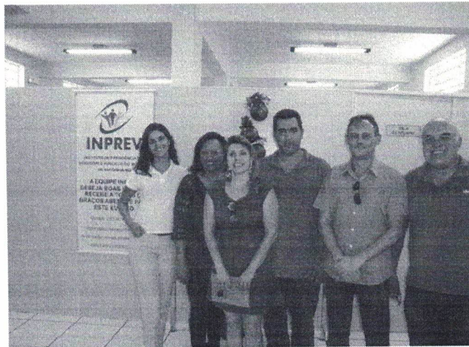
Figura 1 - Membros do Conselho Fiscal