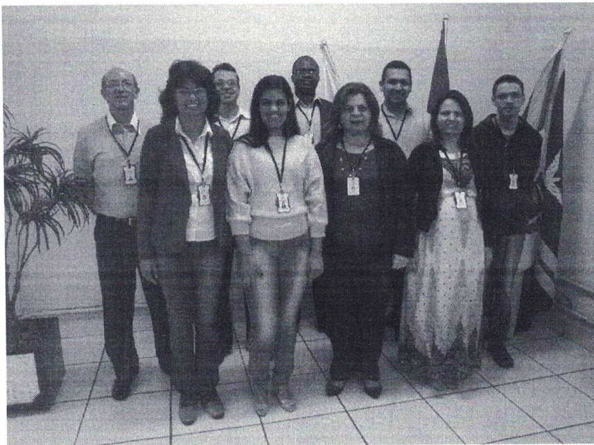
Figura 1 -Servidores do INPREV