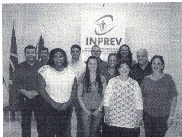
Figura 1 - Membros do Conselho de Administração do RPPS