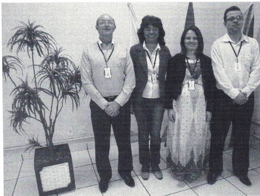
Figura 1 - Membros do Diretoria Executiva