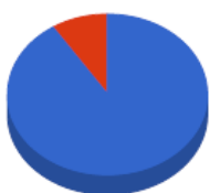
Distribuição por Segmento

● RENDA FIXA 84,26% ● RENDA VARIÁVEL 15,74%